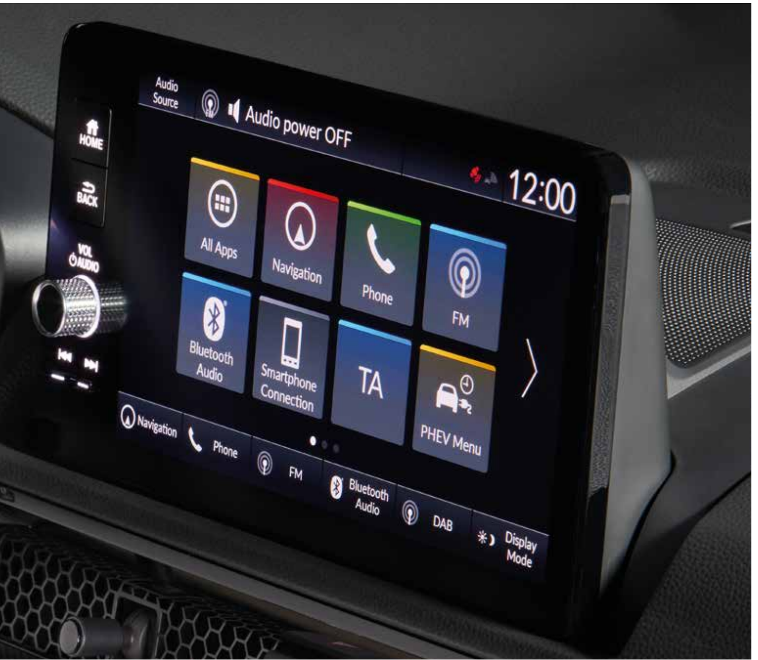
De Nieuwe Honda CR-V