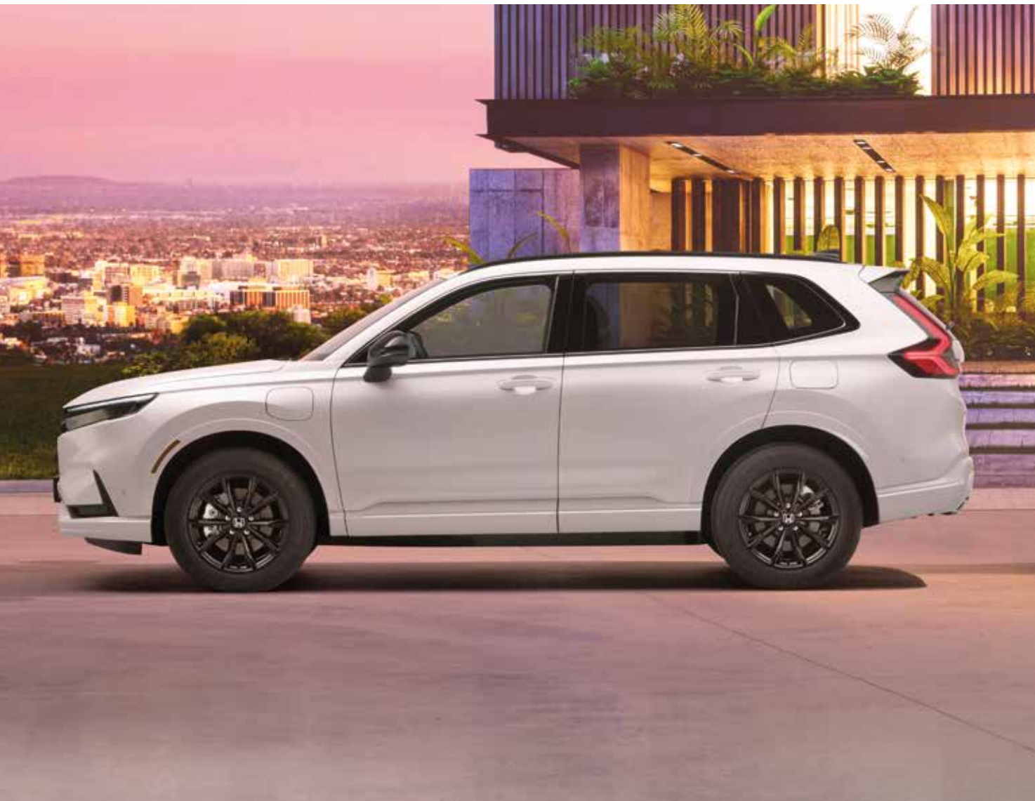
De Nieuwe Honda CR-V