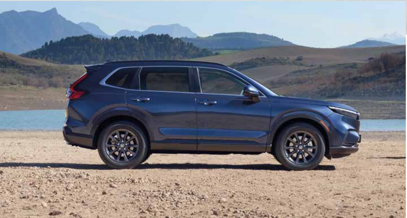
De Nieuwe Honda CR-V